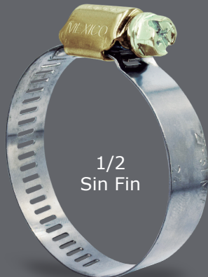
1/2 Sin Fin

Torque Norma SAE: 50 lb/pulg. Torque VARESE: 75 lb/pulg.