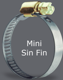
Mini Sin Fin

Productos Fabricados bajo la Norma SAE J-1508